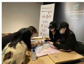
유학생 대상 프로그램